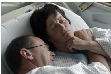
La part de l'autre de Christophe Chiesa 5 x 45 min.