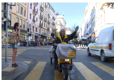
Bienvenue aux Pâquis de Jean-Paul Mudry 5 x 45 min.

Exemples déjà réalisés (pages.rts.ch/docs/) :