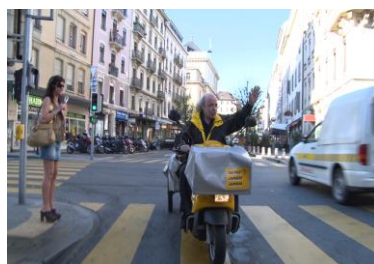
Bienvenue aux Pâquis de Jean-Paul Mudry 5 x 45 min.

Exemples déjà réalisés (pages.rts.ch/docs/) :