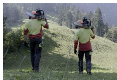
Les apprentis de Fred Florey 5 x 45 min.